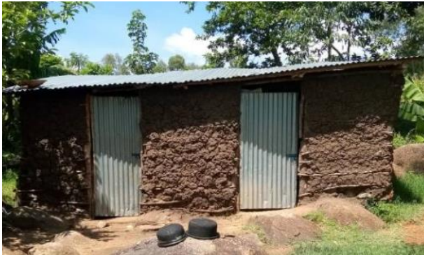
Fertige Küche (linke Türe) mit extra Schlafraum für die Buben (rechte Türe)