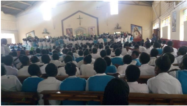
Schulgottesdienst für die bevorstehende Abschlussprüfungen des Schuljahres 2022

Hope Foundation Kenya kümmert sich hauptsächlich um die Schulbildung der Schützlinge. Es ist sehr erfreulich, dass die guten Schülerinnen auch die Universität besuchen dürfen. Doch dies ist Ihnen als treue Sponsoren und Sponsorinnen zu verdanken.