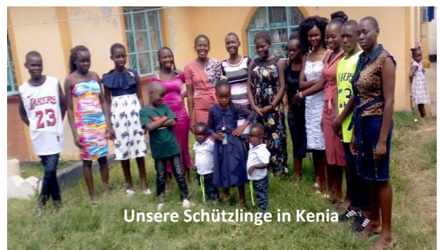
Unsere Schützlinge in Kenia

Herzlichen Dank und herzliche Empfehlung. Ich möchte mit meinem Verein Infrastruktur mehr helfen können.