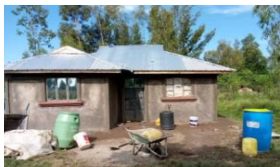
Neues Haus von Familie Owino