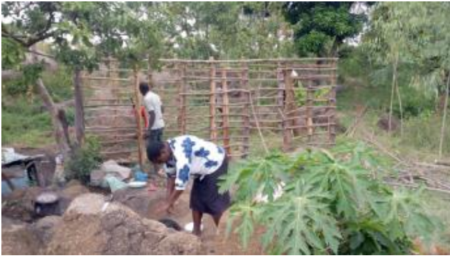
Offene Küche draußen